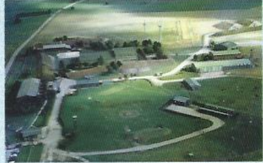
CDC 05.902 Auzainvilliers