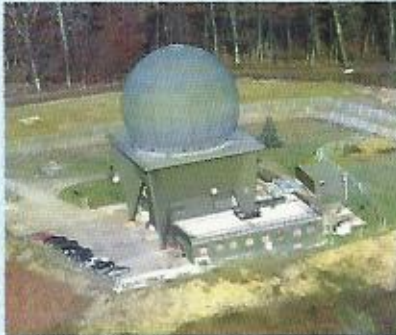
Radar ARES Morville