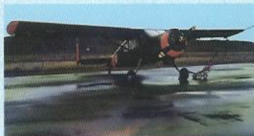
Le Broussard 1968 - 1987