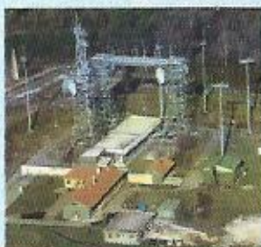
Station Hertzienne 11.801 Beaufremont