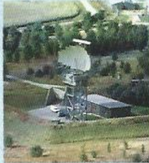
Radar «23 CM» Auzainvilliers