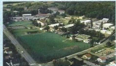
Site de «La Folie» Contrexéville